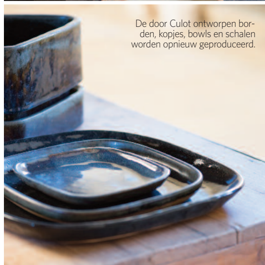
De door Culot ontworpen borden, kopjes, bowls en schalen worden opnieuw geproduceerd.